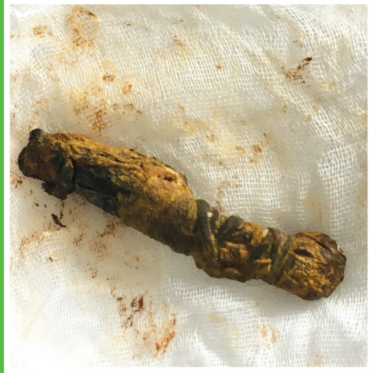
Endoskop ile çıkartılan yabancı cisim