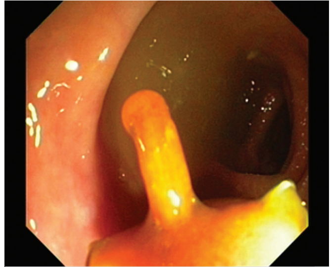
Resim 2. Polipoid oluşum tripot yardımı ile dışarıya alınırken.

63 yaşında erkek hasta. Hipertansyon dışında sistemik bir hastalığı yok. Dört yıl önce yapılmış kolonoskopisinde çapları 10 mm yi geçmeyen birkaç adet polip saptanarak çıkarılmış. Bu poliplerin histolojik inceleme sonucu tubuler adenom olarak gelmiş. Hasta kontrol amaçlı başvuruyor.